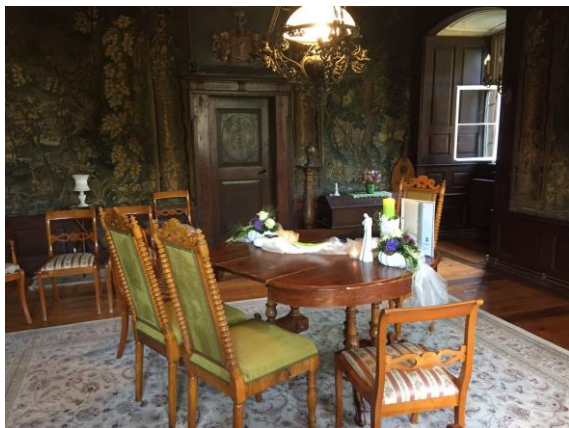
Schloss Riede in Bad Emstal (bis zu 12 Personen)