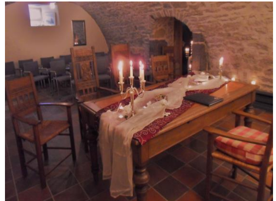
Gewölbekeller im Zierenberger Rathaus (bis zu 24 Personen)