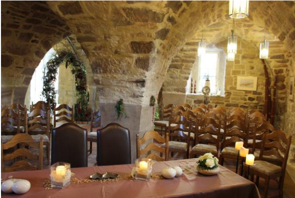
Grimms Märchenkeller im Alten Rathaus in Wolfhagen (bis zu 50 Personen)

Lassen Sie sich von unseren Trauzimmern im Märchenland der Brüder Grimm verzaubern.