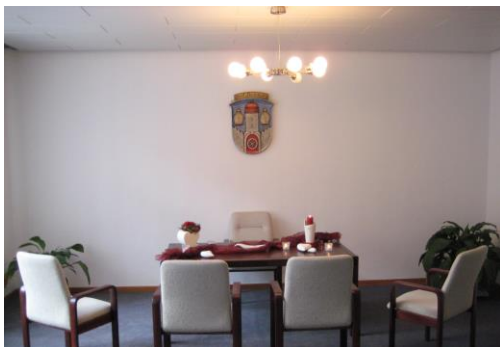
Trauzimmer im Rathaus in Naumburg. (bis zu 24 Personen)

Wir haben Ihr Interesse geweckt und Sie haben sich für uns entschieden? Dies freut uns sehr, denn Sie werden es nicht bereuen. Ihre Eheschließung kann zwischen Montag und Samstag nach Absprache erfolgen. Für Terminvereinbarungen oder Fragen steht Ihnen das Team des Standesamts Wolfhager Land zur Verfügung und berät Sie gern für den schönsten Tag in Ihrem gemeinsamen Leben.