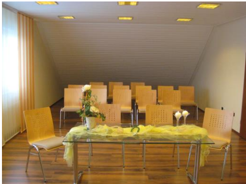
Trauzimmer im Rathaus in Bad Emstal. (bis zu 20 Personen)