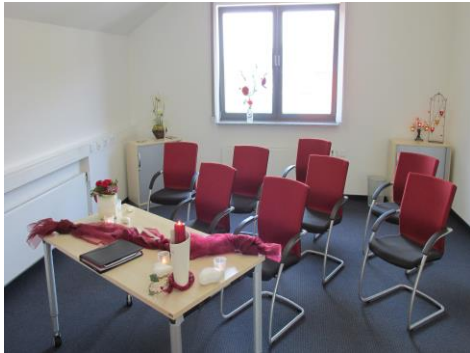
Trauzimmer im Rathaus in Habichtswald (bis zu 30 Personen)