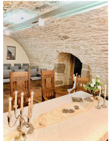
Gewölbekeller im Zierenberger Rathaus (bis zu 25 Personen)