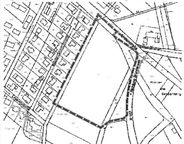
Teilungsbereich B des Bebauungsplans Nr. 72