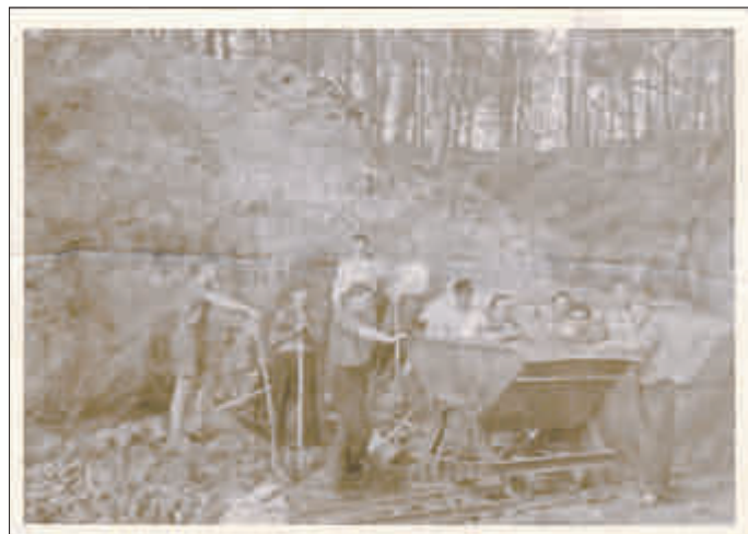
Foto von den Erdarbeiten der TSV-eigenen Sporthalle

Radtour 15.5.2021, Familienwandertag 03.06.2021, Bilderausstellung & Vorstellung der TSV Chronik, 5./6.6.2021, Ehrungstag 30.10.2021.