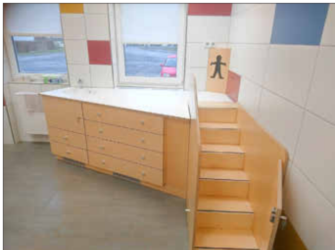
Der neue Wickelbereich

Die Um- und Anbauarbeiten im Kindergarten wurden Anfang März abgeschlossen. Die letzten Arbeiten - Einbau eines zweiten Wickelbereichs und die Installation der Brandmeldeanlage – sind fertiggestellt.