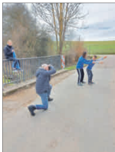
TSV-Mitglieder im Foto-Session-Einsatz: Vor und hinter der Kamera.