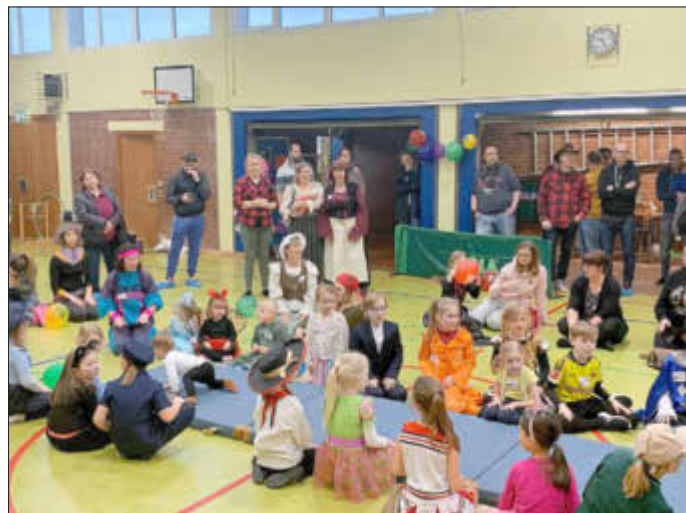
Eine der wichtigsten TSV-Sparten, das Kinderturnen. Hier ein Bild vom Karneval im Jahr 2020.