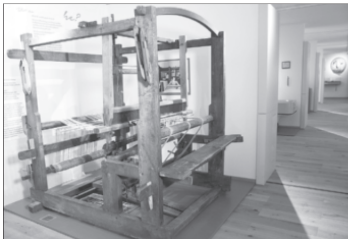
Webstuhl im Klostermuseum Bad Emstal

Klostermuseum Bad Emstal Landgraf-Philipp-Str. 2 34308 Bad Emstal-Merxhausen