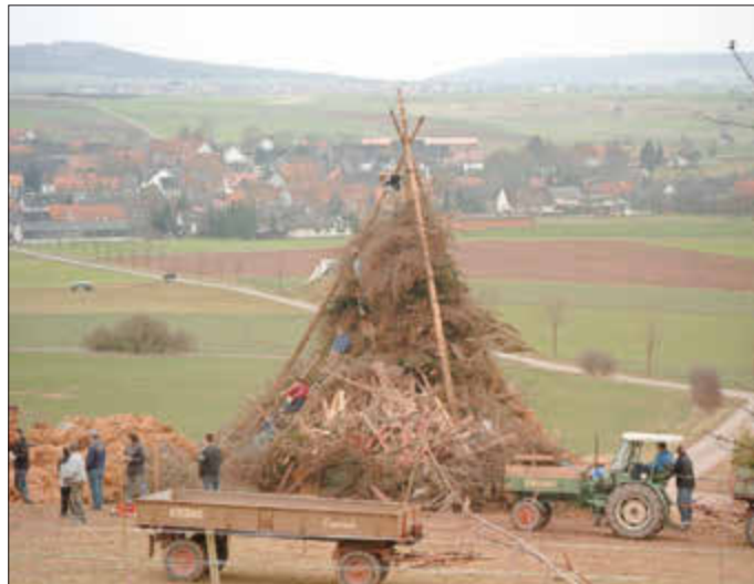
Osterfeuer Aufbau 2011