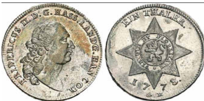
Sterntaler Friedrichs II. von Hessen-Kassel aus dem Jahr 1778