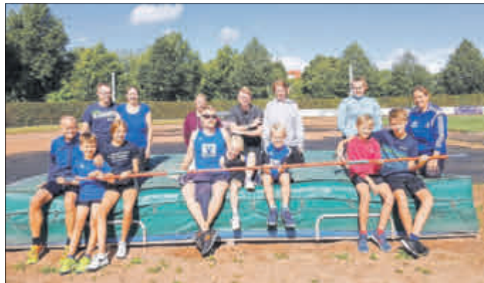
Nochmal die Aktiven vom TSV-Lauffreife - hier beim Sportabzeichen in 2020

Für 2021 ist eine Beteiligung am Kassel Marathon über 21 km oder mit Staffeln, erneut geplant.