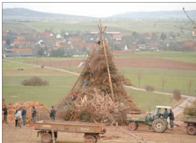
Aufbau zum Osterfeuer im Jahr 2001