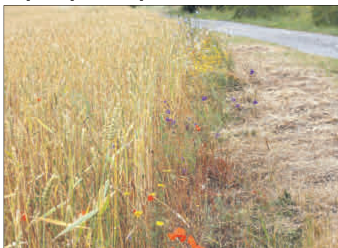
Positiv- und Negativbeispiel zugleich

Dass es der Tier- und Pflanzenwelt der Feldflur schlecht geht, ist mittlerweile den meisten Menschen bewusst. Die Zahlen vieler Vogel-, Insekten- und auch Pflanzenarten sind in den letzten 20 Jahren regelrecht eingebrochen. Bei manchen muss man befürchten, dass sie aussterben. Ein Hauptgrund ist, dass sie in unserer intensiv genutzten Landschaft zu wenig Nahrung bzw. Rückzugsräume finden.