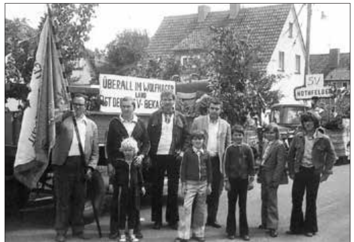
TSV-Histore: TSV-Aktive beim Wolfhager Viehmarktsumzug in 1974

Mittelpunkt des Dorfes ist seit jeher die im Jahr 1748 neu errichtete Kirche mit ihrem Turm, der Merkmale der gotischen Bauweise des 14. Jahrhunderts aufweist. Die Aufzeichnungen im Kirchenbuch beginnen im Jahr 1604.