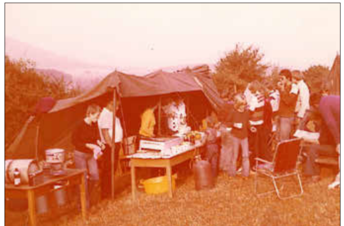
Ein Blick zurück: TSV-Zeltlager 1979

Radtour 15.5.2021, Familienwandertag 03.06.2021, Bilderausstellung & Vorstellung der TSV Chronik, 5./6.6.2021, Ehrungstag 30.10.2021.