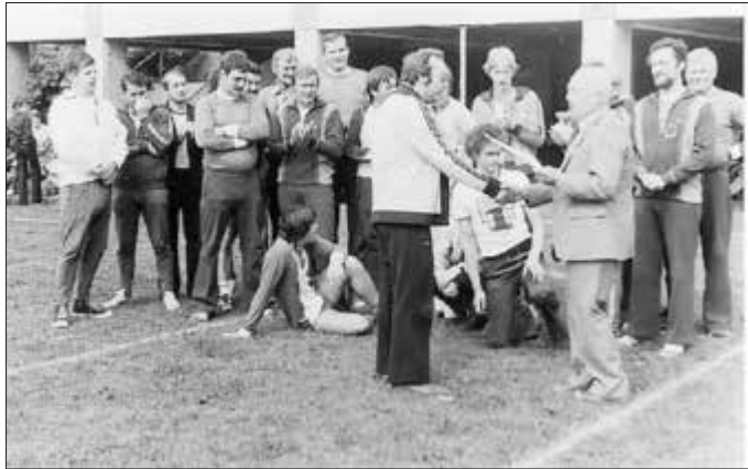
TSV Historie: Ein Blick zurück in unsere ehemalige Abteilung Faustball

Zu Ostern und zu Beginn der Adventszeit haben wir jeweils einen TSV-Gruß mit kleinen Präsenten an die Wenigenhasunger Haushalte verteilt und uns bemüht ein positives Zeichen zu setzen. Darüber hinaus haben wir uns an einigen Nachhaltigkeits- und Umwelt-Aktionen sowie bei der Friedhofs-Reinigung mit zahlreichen Mitgliedern beteiligt. Der TSV hat sich auch in 2020 an der HNA Aktion Advent für benachteiligte und bedürftige Mitmenschen in unserer Region beteiligt und mit Spenden von jeweils 100 € die Wolfhager Tafel und die „Kleinen Riesen“ in Kassel unterstützt.