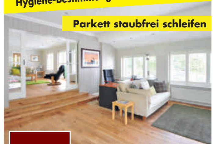
Parkett staubfrei schleifen

Unsere Arbeiten werden nach den Hygiene-Bestimmungen ausgeführt.