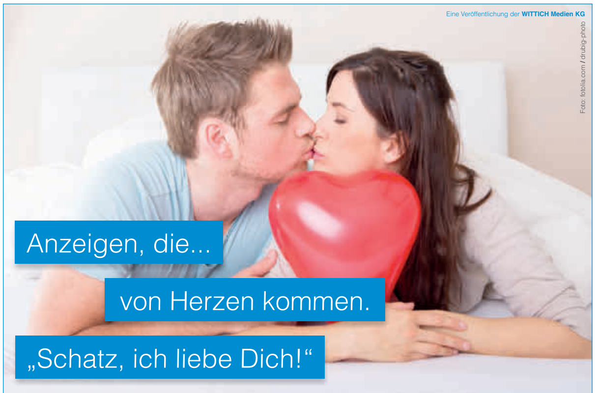
Eine Veröffentlichung der WITTICH Medien KG

LINUS WITTICH Lokal informiert. Druck. Internet. Mobil.