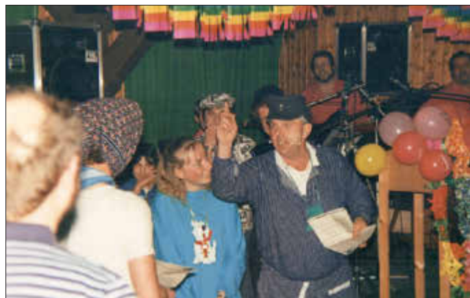
Karneval der Vereine in den achtziger Jahren in der Aussicht