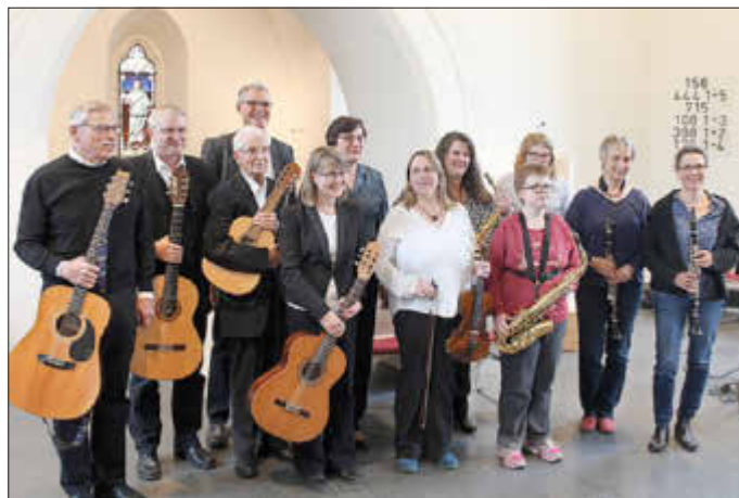
Musik ist die beste Medizin: Sie macht fröhlich und hält jung!