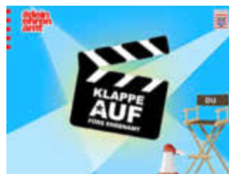
Gewinn- und Mitmachaktion „Klappe auf fürs Ehrenamt“

Alle Ehrenamtler, Vereine, Stiftungen und Initiativen aufgepasst: Jetzt mitmachen bei der neuen Gewinn- und Mitmachaktion und 500 Euro gewinnen!