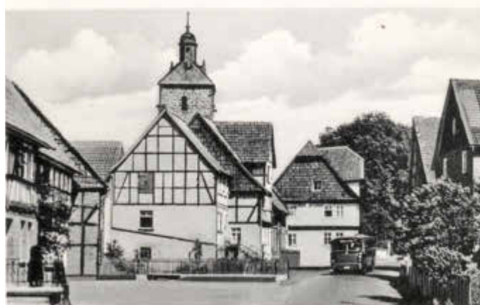
Gruß aus Istha, von Kassel