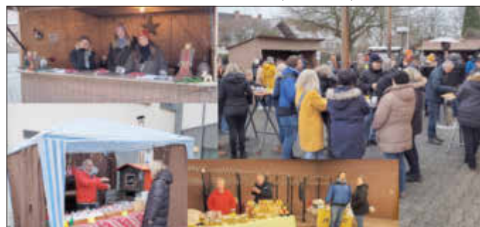
Weihnachtsmarkt in Niederelsungen