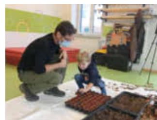
Meilo sucht ein Töpfchen für seine Eichel