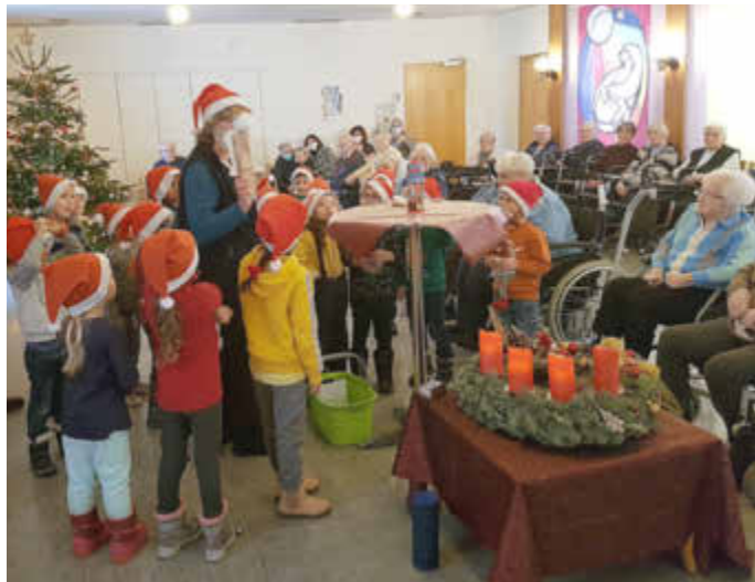
Wichtelgeschichte mit Zauberknall

In der Woche danach trafen wir uns täglich im großen Flur der Kita, um miteinander Nikolaus- Schnee- und Weihnachtslieder für den Besuch bei den Senioren einzüben. Den meisten Spaß hatten die Kinder beim „Schneeflocken hüpfen“ Mitmachlied.