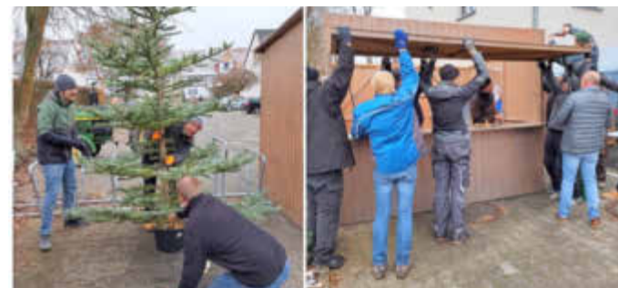
Gemeinsamer Aufbau des Weihnachtsmarkts

Am dritten Adventssonntag hat der Weihnachtsmarkt in Niederelsungen stattgefunden. Die Niederelsunger Vereine haben sich gemeinsam um die Vorbereitung und Durchführung gekümmert. Wieder ein schönes Beispiel dafür, was Gemeinschaft bewirken kann.