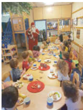
Nikolaus besucht die blaue Gruppe eine Mandarine. Herzlichen Dank.