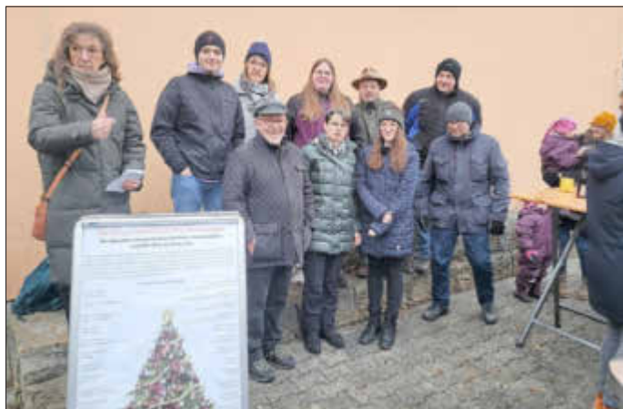
Übergabe der Spendengelder auf dem Weihnachtsmarkt

Wie auch in den vergangenen Jahren hieß es auch dieses Jahr wieder: Spende statt Geschenke! Seit 1990 folgt die Tradition der Werbegemeinschaft Niederelsungen bereits diesem Motto und spendet gemeinsam Geld für gute Zwecke statt viele kleine Geschenke für die Kundschaft zu besorgen. In diesem Jahr kam so eine stolze Summe von 3.400 Euro zustande.