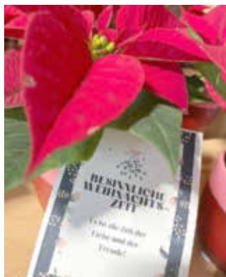
Der Weihnachtsstern mit einer kleinen Grußkarte

Die Mitglieder des Ortsbeirats freuen sich, dass der Seniorennachmittag endlich wieder stattgefunden hat. Pandemiebedingt war dies leider im vergangenen Jahr nicht möglich. Die zahlreichen Gespräche haben gezeigt, dass so ein Zusammenkommen wichtiger denn je ist. Deshalb steht der Termin für den Seniorennachmittag 2023 bereits fest und zwar am 10. Dezember 2023. Am Sonntag, den 4. Dezember sind circa 40 Senioren und Seniorinnen der Einladung gefolgt und zum Seniorennachmittag ins HdG gekommen. Bei guter Stimmung, Kuchen und Kaffee wurde ein bunter Nachmittag verlebt, nicht nur durch die schönen bunten Teelichter, die die Kindergartenkinder