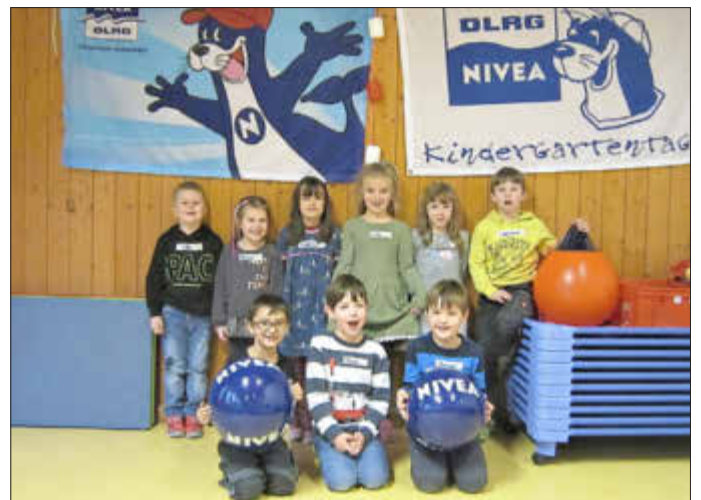
Gruppenbild der Vorschulkinder

Die Durchführenden der DLRG Breuna e.V. sind geimpft und beachten die aktuellen Corona-Auflagen.