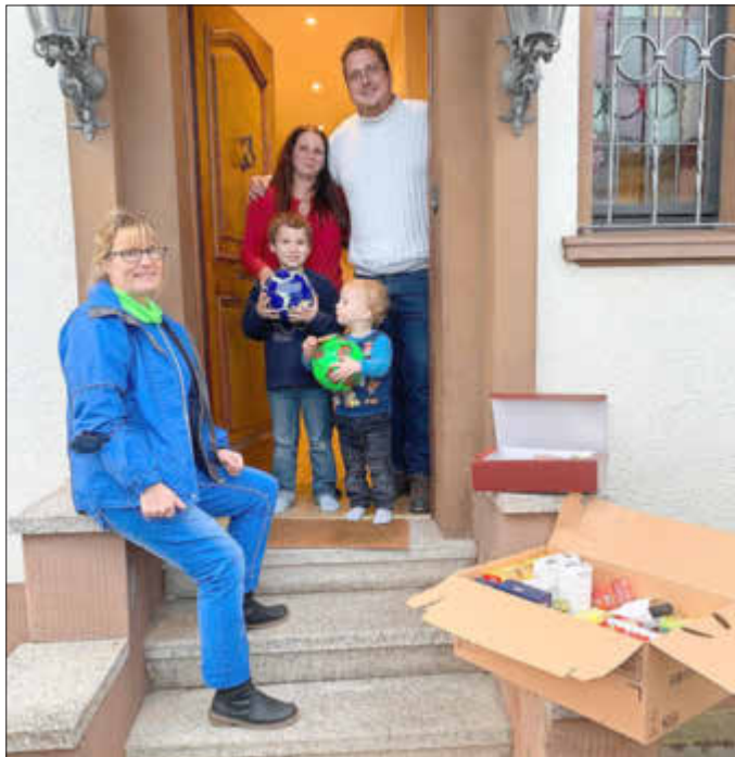
Die Übergabe von Spenden an besonders betroffene Familien ist ein zentraler Bestandteil der TSV-Aktionen im Ahrtal