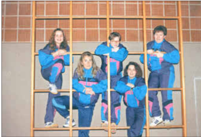
Ein Blick in die Historie: Die Gesichter unserer ehemaligen TT Damenmannschaft

Der TSV wünscht allen Mitgliedern und Unterstützer*innen eine schöne Weihnachtszeit und einen guten Rutsch in ein gesundes 2022!