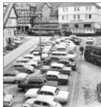
Park-Chaos auf dem Marktplatz in den 1950er- und 1960er-Jahren

Die Herausgabe dieses Bandes wird rechtzeitig vor dem Weihnachtsfest erfolgen. Autor und der Wolfhager Litho-Verlag werden zu mindestens zwei Buchvorstellungen ab Anfang Dezember einladen.