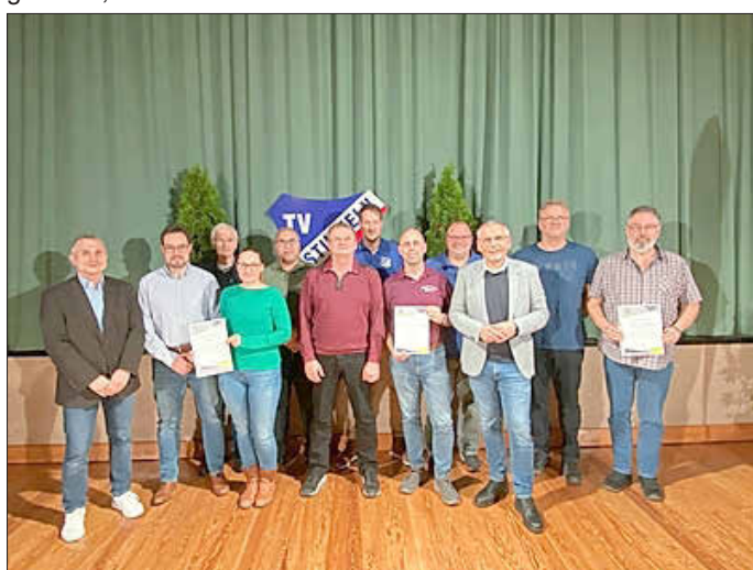
Sportvereine Wolffhager Land