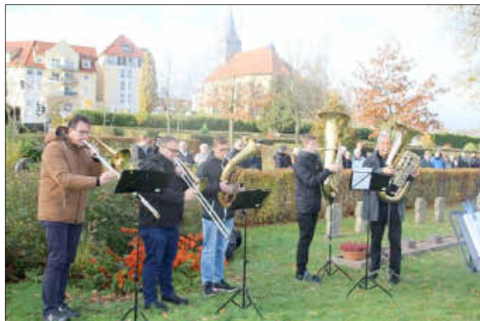
Posaunenchor der evang. Kirchengemeinde Wolffhagen

Im Anschluss an den Gottesdienst wurde die Gedenkstunde auf dem Wolffhager Ehrenfriedhof fortgeführt.