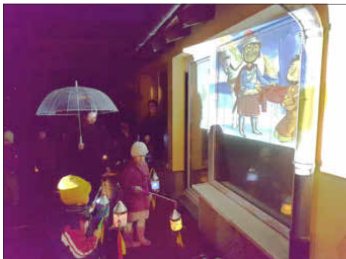
Singen und Schauen

Jedes Jahr freuen sich die Kinder auf das St. Martinsfest. Mit großer Begeisterung wurden in den Wochen vorher die Laternen gebastelt. Zur Auswahl standen Raketen, Einhörner, Handabdrucklaternen oder bunt beklebte Luftballons. Der Martinsumzug wurde vom Vorstand unseres Fördervereins vorbereitet.