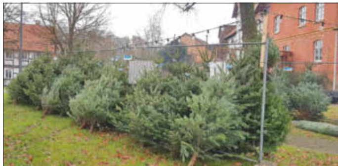
Verkaufsfläche auf dem Dorfplatz vor der Kirche

Am Samstag, 11.12.21 Weihnachtsbaum in Wenigenhasungen holen.