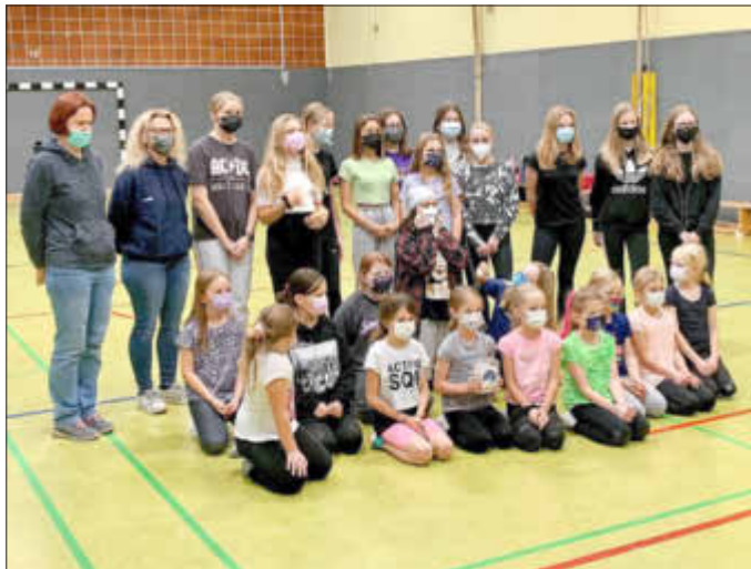
Die TSV-Streetdance-Gruppen Power Bundles und Jumpfeet unterstützen die Aktion Advent