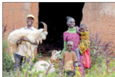
Familie mit Ziegen

Die Lebensbedingungen der Menschen in Afrika nachhaltig zu verbessern, darauf setzt der gemeinnützige Verein LOGOS Global Vision und startet in Wolfhagen die Weihnachtsspendenaktion „Määährry Christmas“. Mithilfe von Ziegen sollen in fünf verschiedenen Dörfern Kenias Hilfe zur Selbsthilfe geleistet werden, denn Ziegen liefern als wirtschaftlich genutzte Tiere gute proteinhaltige Nahrung, Dünger und Nachwuchs. Mehr als ein Drittel der kenianischen Bevölkerung lebt in extremer Armut. Viele Menschen müssen von nur einer Mahlzeit am Tag überleben. Die wirtschaftlichen Auswirkungen der Corona-Pandemie verschärften das Hungerproblem. Von der Aktion sollen einzelne Familien wie auch ganze Dorfgemeinschaften profitieren, für die kleine Ziegenfarmen eingerichtet werden.