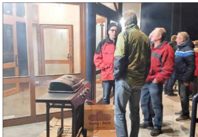
Wintergrillen - Mitwirkung des Ortsbeirats beim Adventskalender 2020