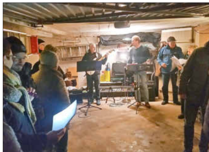
Weihnachtslieder in der Garage

Unter den momentan jeweils gültigen Bedingungen wird auch in diesem Jahr der „Lebendige Adventskalender“ in Istha stattfinden. Die Veranstaltungsorte entnehmen Sie bitte dem verteilten Infoblatt. Die Aktionen finden fast alle im Innen- oder teilweisen Außenbereich statt. Im Innenbereich gelten zwingend die 2G-Regeln. Der für den dritten Advent geplante Weihnachtsmarkt wird nach Rücksprache der Vereinsvertreter in diesem Jahr nicht stattfinden.