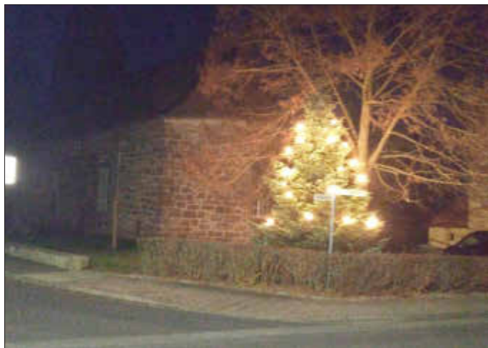
Danke Familie Knatz für die Baumspende

Seit dem 24. November finden wir vor der Kirche eine von Familie Helga Knatz gespendete Tanne vor. Es ist eine schöne Tradition, Bäume, die zu groß geworden sind oder aus anderen Gründen gefällt werden müssen, kurz vor der Adventszeit an öffentlichen Orten aufzustellen. Sie erfreuen dann noch einmal für mehrere Wochen das Auge und das Herz des jeweiligen Ortes.