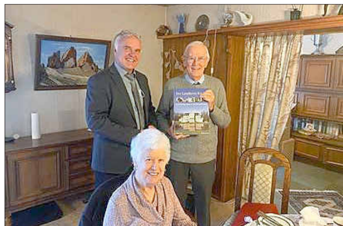
von rechts: Astronaut Charles Duke und seine Ehefrau des Astronauten Dorothea Duke, wohnhaft in Texas, links: Bürgermeister Schaake