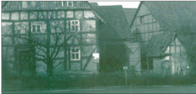
Altes Backhaus

Die Nachtwächter wurden von der Polizei kontrolliert, ob sie auch alle Runden gingen. Der Erzähler hat als Kind von ihrem Grundstück aus sieben Mal das Blasen gehört. In der Weihnachtszeit sang er bei seiner 1. Runde zusätzlich Weihnachtslieder.