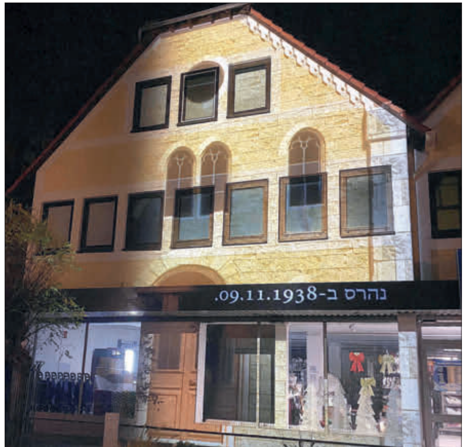
Lichtprojektion ehemalige Synagoge Wolfhagen