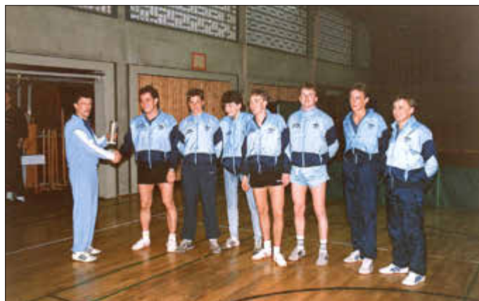
Blick in die TSV-Historie: Die Erste in 1988 bei einer Pokalübergabe.