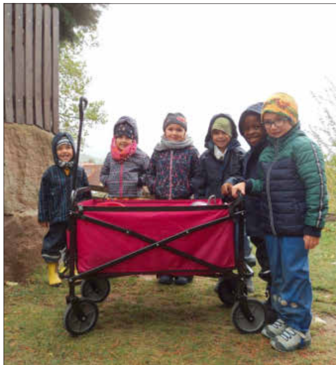
Freude über den Bollerwagen

Endlich ist es so weit, der Herbst entfaltet sich im „Haus der kleinen Füße.“ Neben vielen Bastelangeboten, wie Drachen, Igel, Kastanienketten, Herbstblättern und Mobiles werden natürlich schon die ersten Laterne gebastelt.