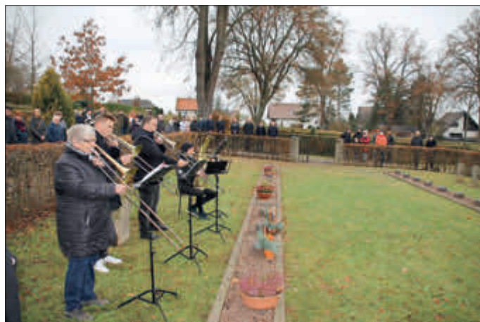
Posaunenchor der Ev. Kirchengemeinde Wolfhagen