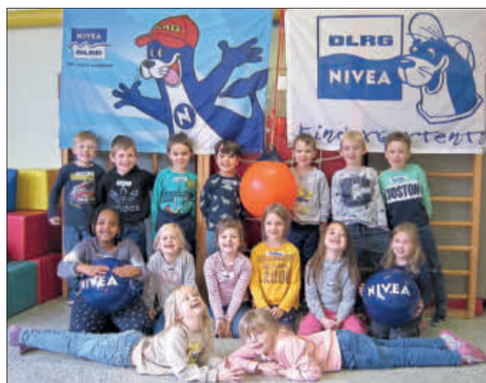
Gruppenbild der Vorschulkinder

Die fünf bedeutendsten der lebenswichtigen Baderegeln erlernten die Kinder per Puzzle, das sie im Wettkampf zusammenbauen mussten. Sieger waren die Mädchen. Es gab auch eine Lerneinheit, wie man sich im Winter auf den Eisflächen richtig verhält. Beim Einsatz der Wurfleine, um eine Kind im Wasser zu retten, legten sich die Kinder so richtig ins Zeug. Schnell hatten sie ihren Spielkameraden gerettet und tauschten die Rollen, damit jeder einmal in den Genuss kam, Lebensretter zu sein. Der Ortsverband Breuna hat seit Ende Oktober 2021 mit einer erneuten Staffel des DLRG Kindergartenprojektes begonnen. Das Projekt wird durch das Unternehmen Beiersdorf unterstützt. So durften am Ende alle ein Malbuch und einen NIVEA-Wasserball mit nach Hause nehmen. Ganz sicher dient das auch zur Motivation, sich weiterhin an die Baderegeln zu erinnern.