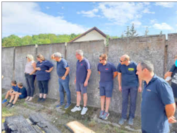
Anspannung vor dem Start

Nicht mit Schauübungen und technischen Wettkämpfen, sondern etwas lockerer mit einem gewissen Spaßfaktor. Nach musikalischem Frühschoppen und Vorführungen von Kindergarten und Grundschule wurde am Nachmittag ein Spaßwettkampf veranstaltet.