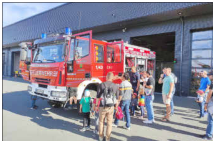
Einige Besucher bei der Besichtigung eines Feuerwehrfahrzeugs.

In der Feuerwehr durften alle Großen und Kleinen schauen und manches auch ausprobieren.