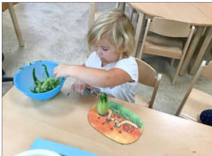
Leia schnippelt für den Obststeller

Die Kinder haben somit Gelegenheit bekommen die Obst- und Gemüsesorten mit allen Sinnen zu erfahren. Mit Geschichten, wie der über den Kartoffelkönig, mit Liedern und Fingerspielen kamen die Ohren in Aktion. Auch Hände und Augen hatten viel zu tun: Es wurden Bilder gemalt und Herbstliches gebastelt, geklebt und ausgeschnitten.