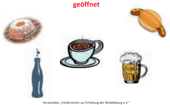
Veranstalter „Förderverein zur Erhaltung der Weidelsburg e.V.“

am 15. Oktober 2023 von 11.00 – 17.00 Uhr geöffnet