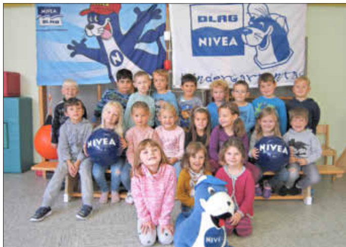
Gruppenbild der Vorschulkinder

Der Ortsverband Breuna e.V. hat ab September mit einer erneuten Staffel 2021/22 des DLRG/NIVEA Kindergartenprojektes begonnen. Beim Besuch des Kindergartens in Zierenberg am 06.10.2021 zogen sich die fünf bedeutendsten der lebenswichtigen Bade- und Eisregeln wie ein roter Faden durch den sehr abwechslungsreichen Vormittag.