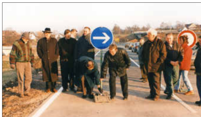
Eröffnung des ersten Bauabschnitts der neuen Umgehungsstraße im September 1998