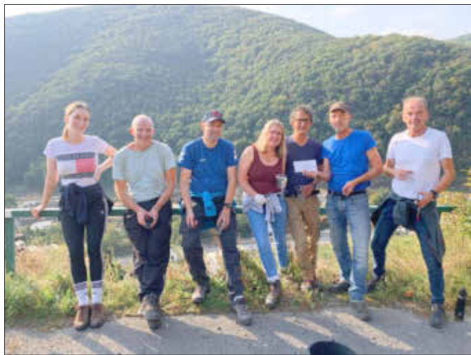
Übergabe einer Geld-Spende an eine betroffene Familie in Walporzheim in der Pause bei der Weinlese.

JHV für die Jahre 2020 und 2021 am 22. Januar 2022 ... 23. Januar Familienwandertag ... „verschobenes Jubiläums-Festwochenende“ 16.-19. Juni 2022 ... TSV auf dem Sensenstein: 1.-3. Juli 2022.