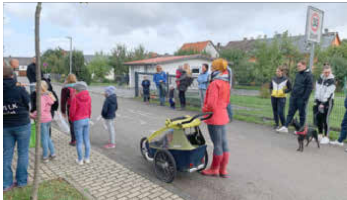
Der TSV bei der Einteilung der Gruppen beim World Cleanup Day für die Müllsammlung