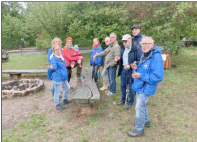
Die TSV Delegation beim Sportkreiswandertag

Im kommenden Jahr wird der TSV den Sportkreiswandertag ausrichten - voraussichtlich am 24. September. Wir würden uns freuen, wenn alle Wenigenhasunger Vereine und Organisationen sich daran beteiligen würden. Weitere Infos hierzu folgen.