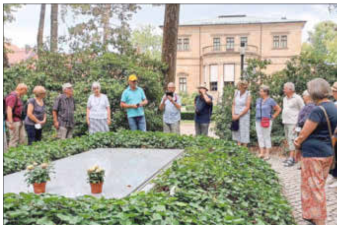
Die Wandergruppe an der Grabstätte von Richard Wagner

Mit viel Vorfreude - nach zwei Jahren Pandemie - startete eine Gruppe des Hessisch-Waldeckischen Gebirgs- und Heimatvereins Wolfhagen zur Wanderwoche in den heilklimatischen Kurort Bischofsgrün im hohen Fichtelgebirge. Eingerahmt von den zwei höchsten Erhebungen in Oberfranken, dem Schneeberg (1053 m) und dem Ochsenkopf (1024 m), erwartete der Ort die nordhessischen Wanderer mit hervorragend markiertem Wanderwegenetz.