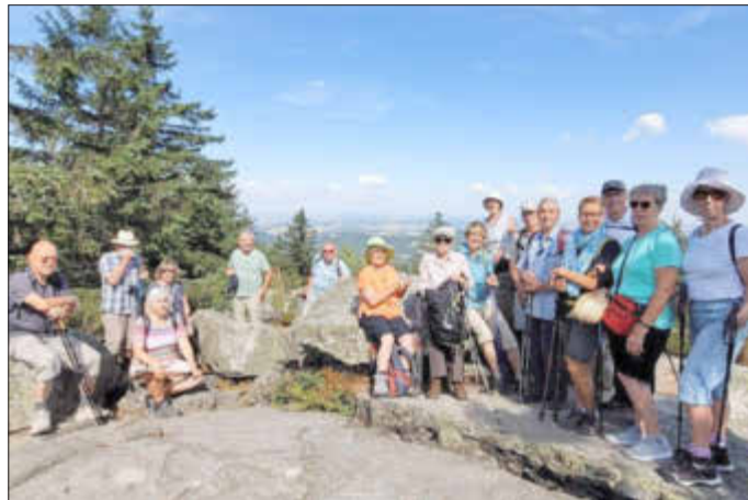
Auf dem 1024m hohen Ochsenkopf