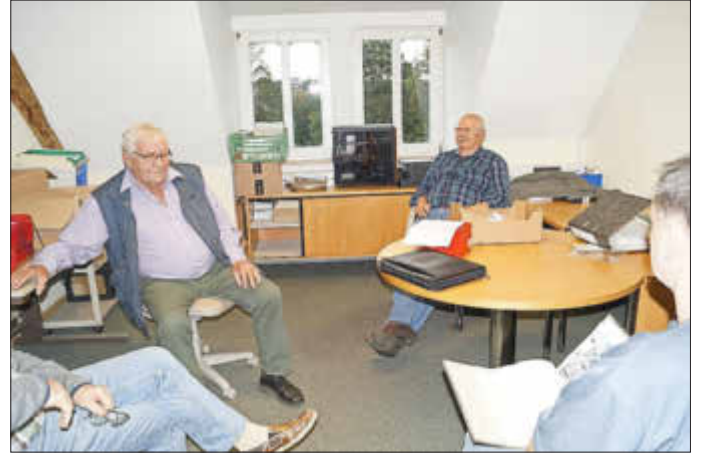
Lagerraum für Bücher und Bilder im Dachgeschoss der Burg

Große Bilderausstellung des Heimat- u. Geschichtsvereins Wolfhagen vom 6. bis 8. Oktober 2022 im Kulturladen