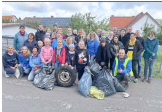
30 Müllsammler/Innen vor dem Bürgertreff in Wenigenhasungen

Vielen Dank an alle, die sich bei der Vorbereitung, Durchführung und dem Sponsoring eingebracht und so zum Gelingen beigetragen haben. Einen herzlichen Dank auch an den Bauhof Wolfhagen für die Entsorgung des gesammelten Mülls.