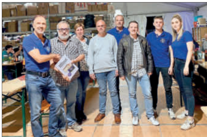
Spendenübergabe vom TSV an den Vorstand vom TUS Ahrweiler

JHV für die Jahre 2020 und 2021 am 22. Januar 2022, 23. Januar Familienwandertag... „verschobenes Jubiläums-Festwochenende“ 16.-19. Juni 2022 ... TSV auf dem Sensesstein: 1.-3. Juli 2022.