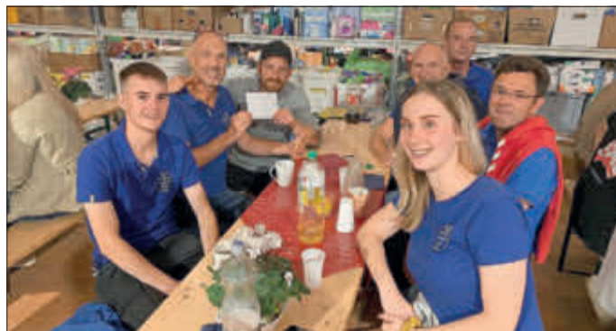
Spendenübergabe vom TSV an das Küchen-Helfer-Team.

Eine Friseurin bietet Haarschneiden neben dem großen Zelt an. Ein Masseur ist sogar im Zelt. Wer jetzt glaubt, dass alles sei staatlich organisiert, der irrt. Alles ist ehrenamtlich. Ins beschauliche kleine Walporzheim kommen Menschen, die einfach nur helfen wollen. Da bringt jeder seine Fähigkeiten ein, über die er verfügt. Ehrenamtlich, in seiner Freizeit und umsonst. Es hat sich ein kleiner „We-Ahr-Together“-Hilfs-Kosmos entwickelt. Gemeinsam und zusammen. Denn nur mit „Wir“ geht es aus dieser Katastrophe heraus. Zeitlich ist der Wiederaufbau ein absolutes Mammut-Projekt. Die Häuslebewohner rechnen damit, dass sie zwischen November und vermutlich auch erst im Frühjahr 2022 wieder in ihre Häuser können. Von der notwendigen Versorgungs-Infrastruktur wie einem Bäcker oder den früher dort unzähligen Kneipen ganz abgesehen. Da ist der Zeithorizont fünf bis zehn Jahre. Und nicht zu vergessen, so beschauliche Örtchen wie Walporzheim gibt es dort an der Ahr einige.