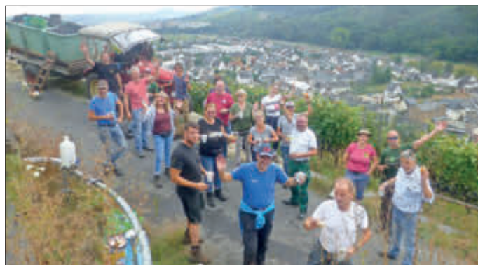
Unsere TSV-Helfer bei der Weinernte im Ahrtal Anno 2021

1.000 € wurden vom TSV an TuS Ahrweiler für Fluthilfe übergeben (aus Spenden für die Chronik und Spenden von TSVlern speziell für die Fluthilfe). Und ergänzende 1.350 € Spenden von Mitgliedern des Golf Club Eschebergs als Barspenden gingen an fünf besonders betroffene Familien und das Küchen-Helfer-Team. Zum Ahr-Einsatz vom 1. bis 3. Oktober berichten wir im nächsten Blättchen.