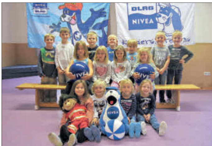
Gruppenbild der kleinen Strolche