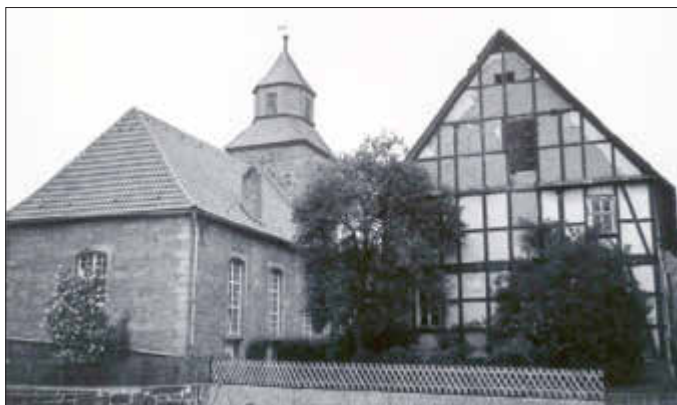
Einen guten und gesunden Start in das Jahr 2022 wünscht der gesamte Ortsbeirat Wenigenhasungen.