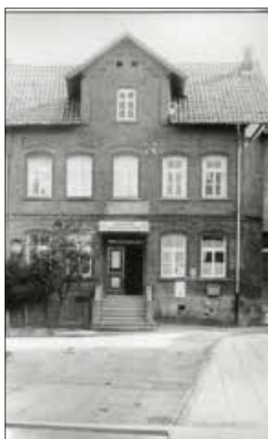
Das Foto zeigt die ehemalige Gaststätte Pflüger

In Wenigenhasungen gab es immer zwei Gaststätten. Krafts Wirtschaft stammt aus dem 19. Jahrhundert.