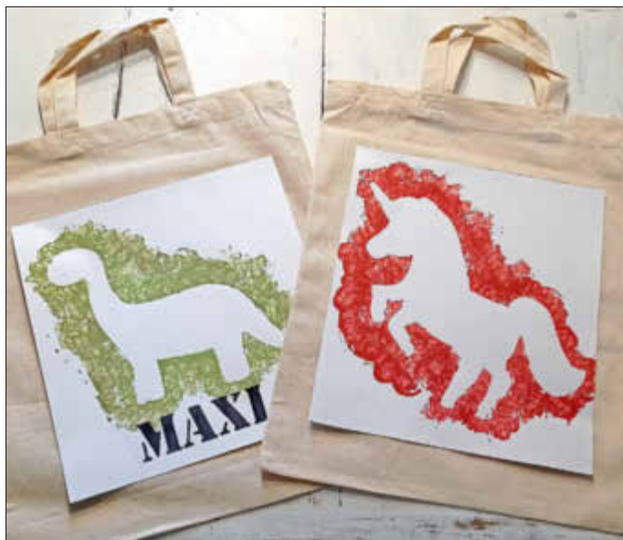
Taschen für den guten Zweck