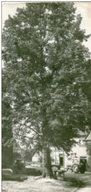
Die alte Dorflinde in der Mitte Wenigenhasungen

Zu den Auswanderern passend die in Wenigenhasungen ausgestorbenen Familiennamen mit Stand aus dem Jahr 1984: