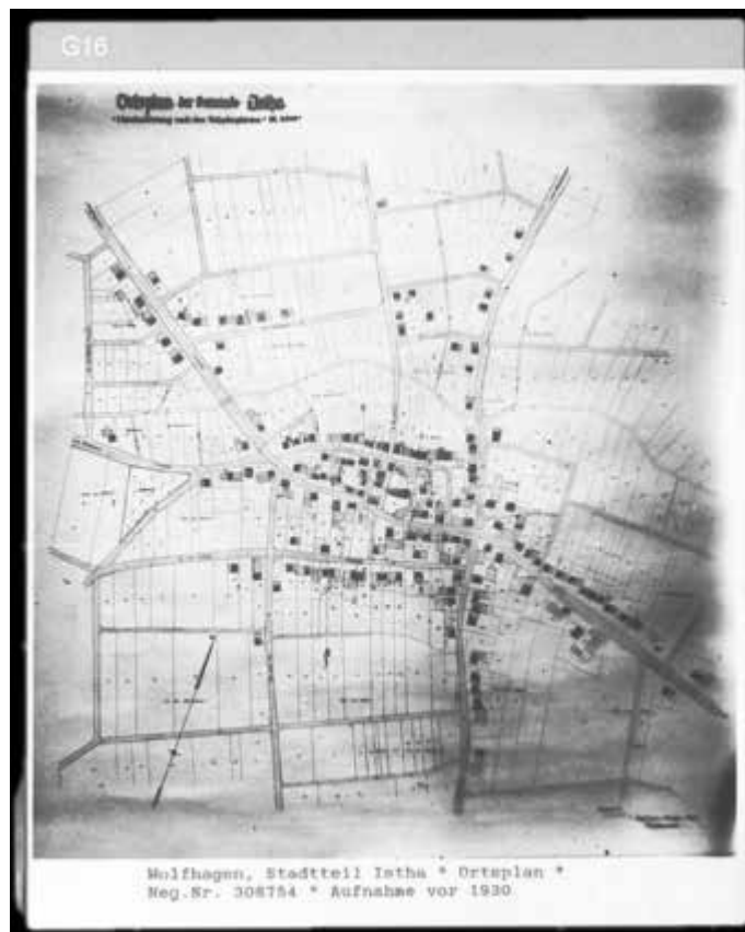
Alter Dorfplan von 1930

Wie vieles, so hat sich auch die Friedhofskultur verändert. Dieses Grabmal stand bis Mitte der 50. Jahre auf unserem Friedhof in Istha