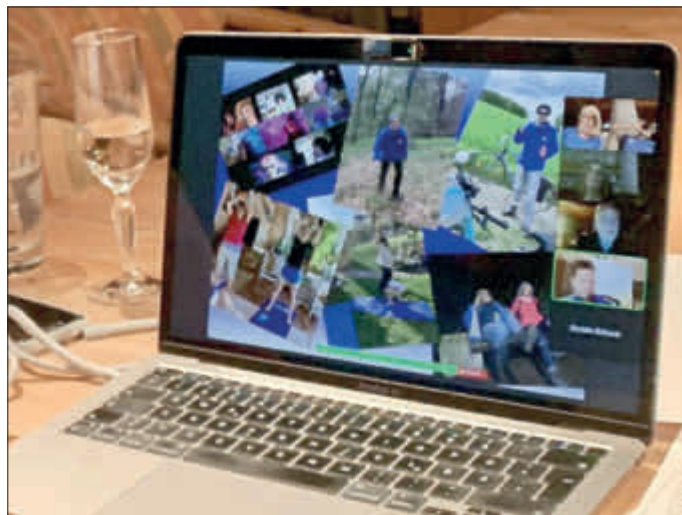
Die virtuelle Jahreshauptversammlung des TSV Wenigenhasungen, hier im Bild.

Dazu zählten eine Baumpflanzaktion am Rohrberg. Am sog. World Cleanup Day 2020 befreiten TSV-Mitglieder das Umfeld der Glascontainer im Dorf und die Grillhütte von Unrat.