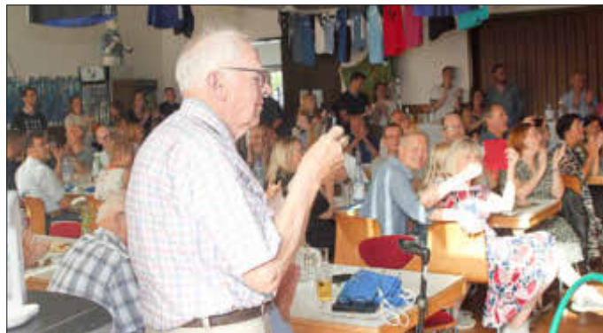
Ein Blick zurück auf eine sehr beeindruckende Veranstaltung im Juni, das 101-jährige TSV-Jubiläum. Begeisterte Zuschauer, da musste unbedingt ein Foto geknipst werden ... Schöne Sommerferien.

27./28. August TSV Weinfahrt nach Walporzheim zur Unterstützung der Ahr-Flutopfer.