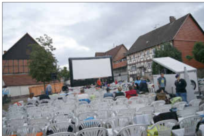
Vorbereitung im Jahr 2019

Die Eintrittskarten gelten wie immer für das Kino und Beiprogramm auf dem Platz. Der Vorverkauf endet am 22.08.2022