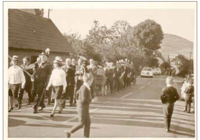
Kirmesumzug in der Balhorer Straße, 50er Jahre