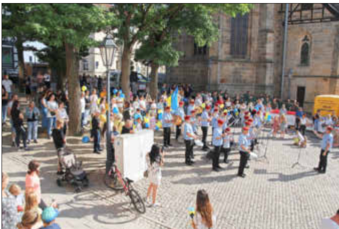
Eröffnung mit dem Spielmannszug der Freiwilligen Feuerwehr

Die Viehmarktsburschen und die Waldbühne Niederelsungen sorgten für den Freibieranstich, während der Musikzug der Freiwilligen Feuerwehr die musikalische Umrahmung übernahm.