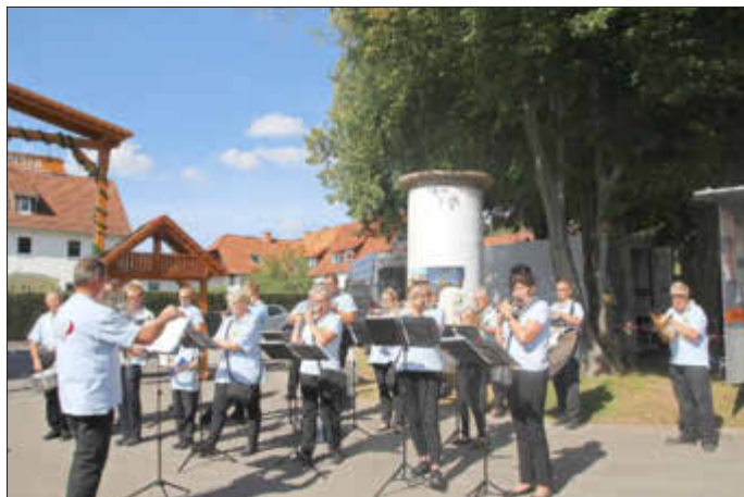
Spielmannszug beim Ständchen spielen

Auch der Spielmannszug der Freiwilligen Feuerwehr ließ es sich nicht nehmen, an mehreren Standorten rund um den Platz ihre Musikdarbietungen zu präsentieren.