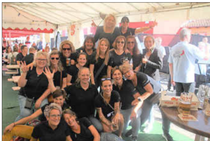
Die Wolfhager Bienchen

Leider musste der traditionelle Festzug am Samstag ausfallen. Trotzdem folgten ein paar Gruppen dem Aufruf, sich dafür ersatzweise auf dem Festgelände zu präsentieren. Die Wolfhager Bienchen versprühten dabei in gewohnter Weise gute Laune und Viehmarktsfreude.