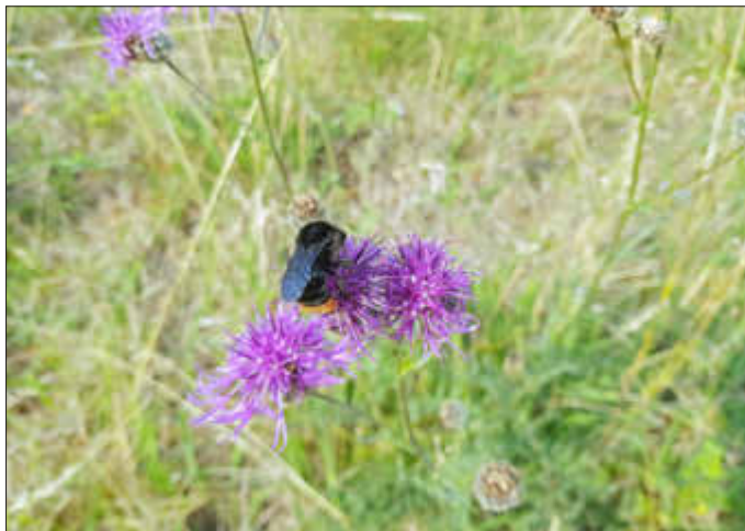
Hummel auf Flockenblume

wieder zu einem Lebensraum für viele Pflanzen und Tiere zu machen. Wer sie nun besucht, wird feststellen, dass sich diese Arbeit wirklich gelohnt hat. Es ist wieder eine bunte Blumenwiese entstanden, auf der die unterschiedlichsten Arten eine Heimat gefunden haben. Neben vielen anderen Insekten fällt vor allem die große Anzahl von Hummeln ins Auge. Damit die Fläche so erhalten bleibt, wird sie in Kürze beweidet werden. Die nachgewachsenen Heckenpflanzen müssen wir im Herbst wieder kurz halten.