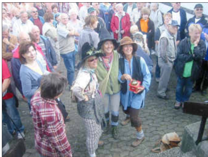
Ein Erinnerungsbild vom Sportkreis-Wandertag 2011, den der TSV ausrichtete, hier mit drei ganz besonderen Wandergästen in der Mitte