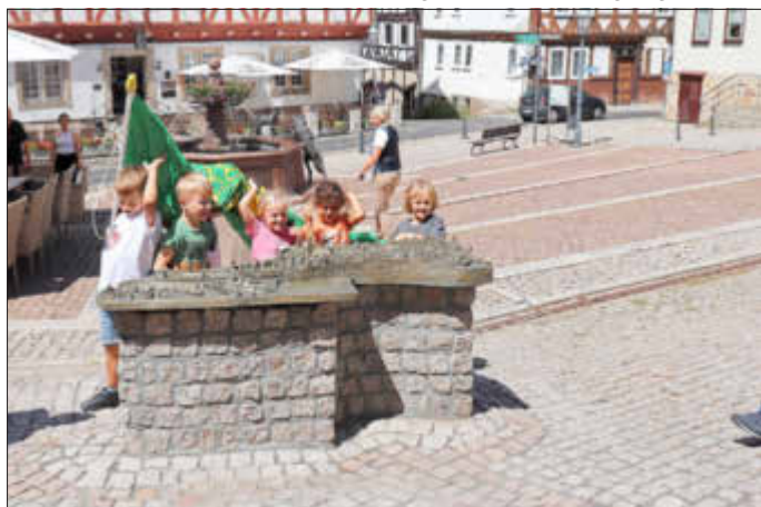
Nach der Enthüllung: Staunen und Freude bei den Kindern