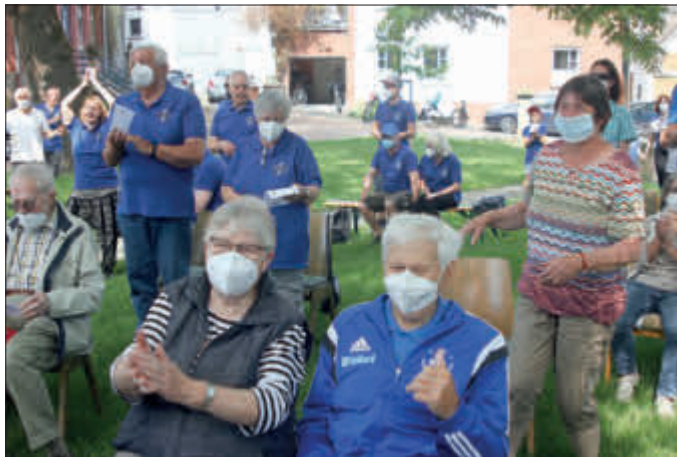
TSV-Familie beim TSV-Gottesdienst im Juni diesen Jahres