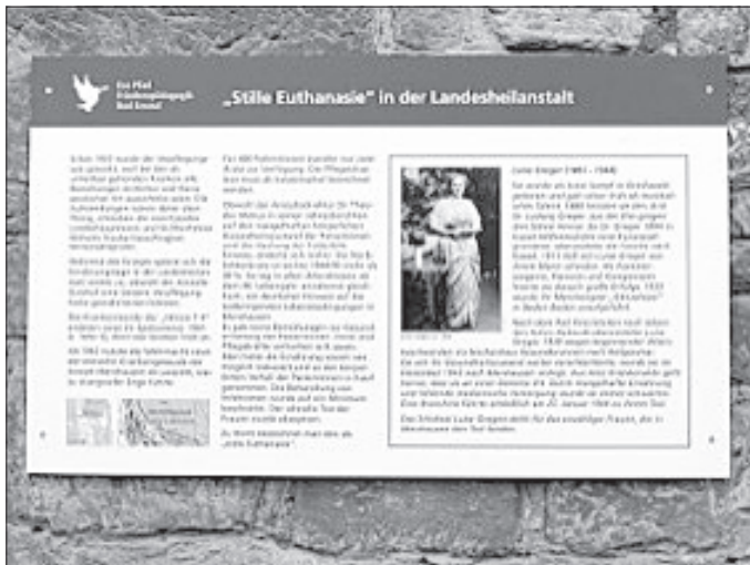
Die neue Eco-Pfad-Gedenktafel am Luise-Greger-Platz in Bad Emstal-Merxhausen

Das Klostermuseum ist am Sonntag von 14.00 bis 17.00 Uhr geöffnet und kann nach der Wanderung noch besucht werden. In den Innenräumen gelten die jeweils aktuellen Corona- Kontaktbeschränkungen (Abstand, Maske tragen, Höchst-Besucherzahl, Besucher-Erfassung schriftlich und ggf. durch QR-Code-Scan mit Corona-App).