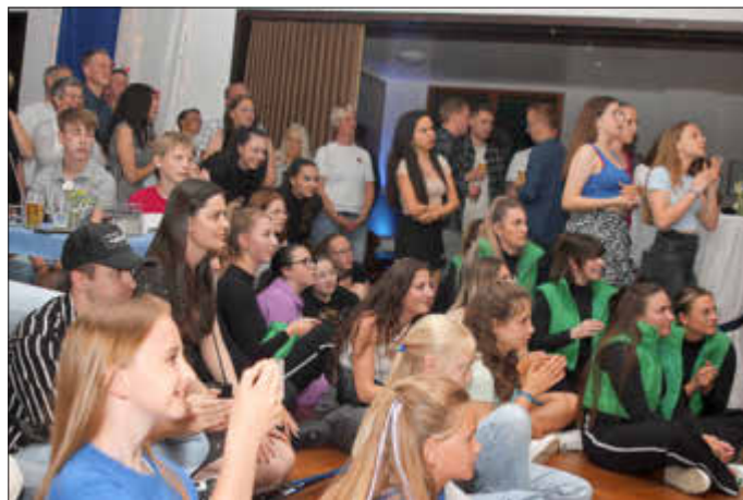
Ganz viel zu bestaunen hatten die Besucher bei der Nacht des Sports des TSV Wenigenhasungen.

Sonntag, 24. September Kreiswandertag in Wenghain.