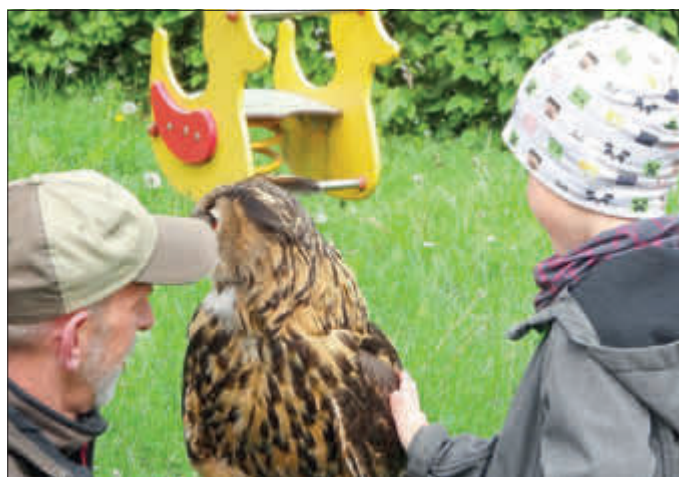
Sogar das weiche Federkleid von Maudi durften die Kinder ertasten