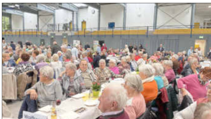
Gespannte Aufmerksamkeit bei den Teilnehmern