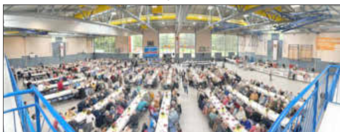
Eine volle Halle

Nach dreijähriger Pause hat der Landkreis Kassel wieder zu den Kreisseniorentagen auf den Sensenstein eingeladen. Für 51 Wolfhager Seniorinnen und Senioren ging es am Mittwoch, den 24. Mai 2023 mit dem Bus zur Jugendburg Sensenstein bei Nieste, um an der Veranstaltung teilzunehmen.