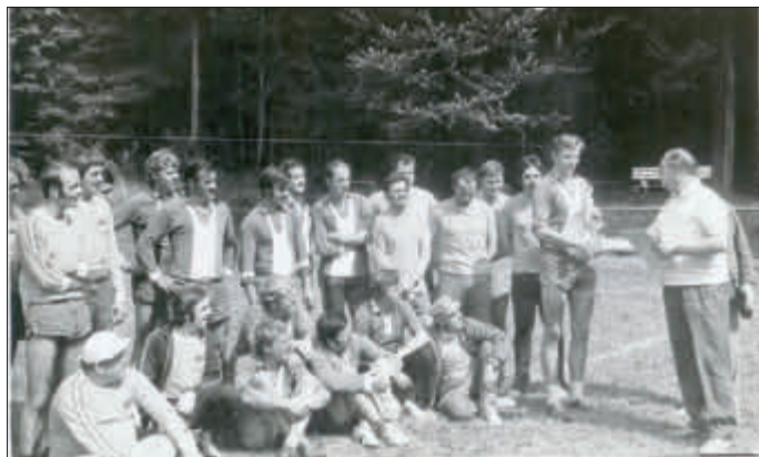
Faustball war lange Zeit die dominierende Sportart beim TSV. Hier ein Bild nach dem Turnier zum 50-jährigen TSV-Jubiläum

„Als Ausgleich zum Turnen wurde zuerst mit Feldhandball begonnen, ehe sich das Turnerspiel Faustball auf dem Forstplatz, wo später die Turnhalle, gebaut wurde, durchsetzte. Alle Turner versuchten sich am Faustballspiel. Es kamen auch weitere Sportler hinzu und immer mehr fanden Freude an diesem Ballsport. Zuerst spielte die Mannschaft auf Kreisebene in der Kreisliga mit Wolfhagen und Volkmarshausen. Später kam dann noch Hoof hinzu. Die Kreisligaspiele fanden, dann wegen der Spielfeldgröße, auf der Liemecke in Wolfhagen statt und der VfL Wolfhagen konnte hier schon immer die Meisterschaft erringen. Im Jahr 1962 wendete sich das Blatt und die Faustballmannschaft des TSV Wenigenhasungen gewann zum ersten Mal den Meisterspokal. In dieser Siegermannschaft kamen zum ersten Mal auch jüngere Spieler zum Einsatz.“