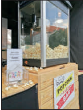
Jennys Popcorn Bar

Auf der Jahreshauptversammlung wird die Wahl daher ohne mulmiges Bauchgefühl auf der Tagesordnung stehen. Wir freuen uns sehr, dass der Förderverein damit weiterhin bestehen bleibt, und seine Arbeit für die KiTa fortführen kann.