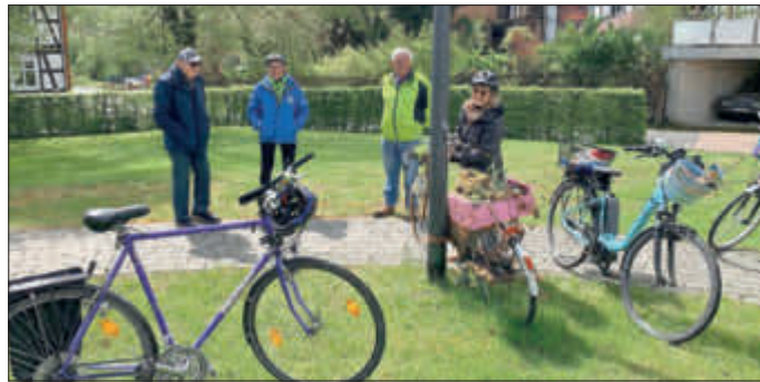
Die Rad-Tour unter besonderen Bedingungen war ein großer Erfolg im TSV-Jubiläumsjahr.

Die Bilderausstellung des TSVs, die seit der Radtour in der Kirche zu besichtigen ist erfreut sich großer Beliebtheit und war auch bei der BON-WAI-Tour am Pfingstsonntag ein Anziehungspunkt für