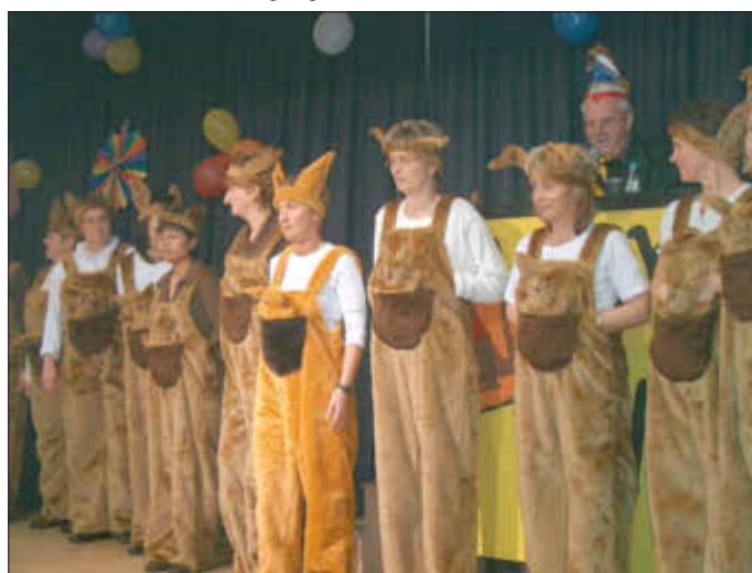
Karneval in Istha (Foto von 2003)