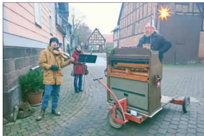
Auf den Straßen in Ehringen war die Musik zum Greifen nahe

Kurfürstenstr. 1 34466 Wolfhagen Tel. 05692 7967 info@musikschule-wolfhager-land.de www.musikschule-wolfhager-land.de