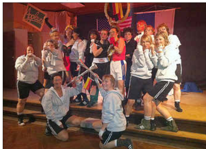
... und so bunt sah die Nacht des Sports in 2012 aus.

14. April: Rad Tour zur Schwimmbad-Eröffnung in Wolfhagen, 04. Mai Nacht des Sports, 09. Juni TSV Radtour im Rahmen von BONWAI, 09. Mai Familien-(Wandertag) zum Vatertag in Istha, 20. Juli Viehmarktumzug „Wir sind Wolfhagen“ mit Auto und Laufgruppe Crazy Steps sowie Streetdance, 24. bis 25. August Vereinsfahrt zur Sandkerwa nach Bamberg, 22. September: Sportkreiswandertag Bründerssen.