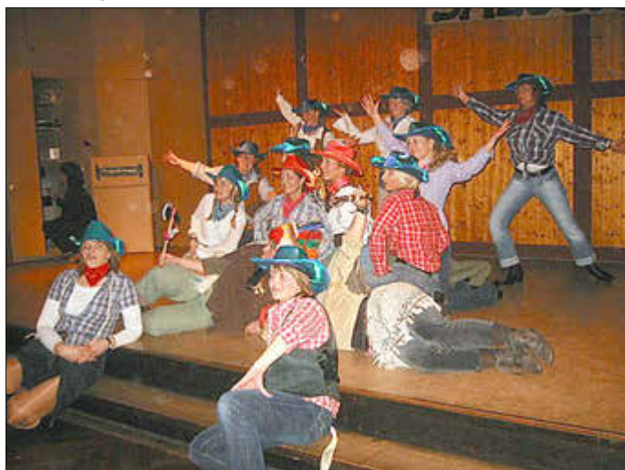
Mitreibende Tänze und bunte Outfits, wie hier 2009, stehen demnächst bei der Nacht des Sports wieder an

Runter vom Sofa und auf zur TSV Fitness, liebe TSVer*innen und solche, die es werden wollen...!