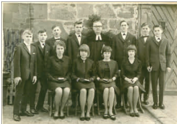
„goldene“ Konfirmation in IsthA