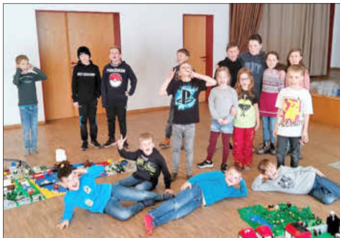
Die Teilnehmer präsentieren stolz ihre Arbeit

Am Ende des Projekts hatte die Kinder- und Jugendarbeit Wolffhagen alle Interessierten eingeladen und so bestaunten Eltern, Großeltern und Geschwister die fertiggestellten Bauwerke und die Kinder präsentierten hierbei stolz ihre Arbeit und erläuterten ihre spannenden Ideen. Anschließend halfen viele Eltern dabei tausende Steine wieder in die ca. 40 Kisten zurück zu sortieren. Die Organisatoren zeigten sich sehr zufrieden mit dem Projekt und eine fünfte Ausgabe wird geplant.