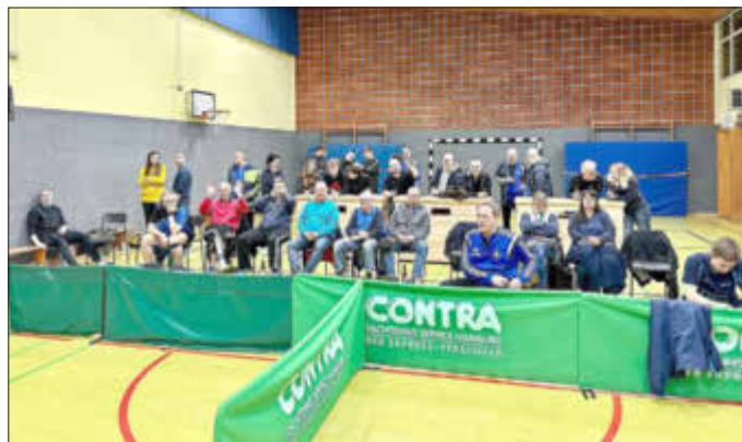
Das Publikum beim letzten Saisonspiel und der Meisterfeier der Ersten

Samstag, 13. Mai TSV-Radtour; Samstag, 10. Juni Nacht des Sports; Sonntag, 24. September Kreiswandertag in Wenghain.