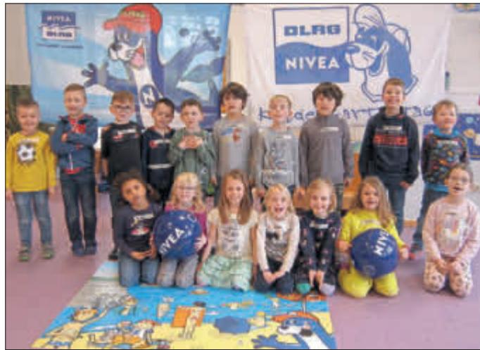
Gruppenbild „Die kleinen Strolche“ Burghasungen

Zum Abschied gab es für alle 17 TeilnehmerInnen der angehenden Abc-Schützen zum Malbuch noch einen NIVEA - Wasserball. Die Firma Beiersdorf AG in Hamburg ist Sponsor dieses Kindergartenprojektes.