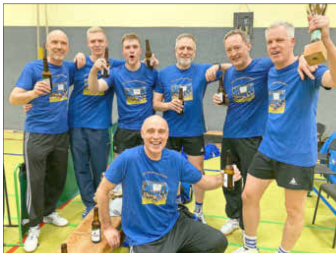
Auch im letzten Spiel hatte die Erste Grund zum Jubeln: Diemeisterlichen Spieler der Ersten TSV Mannschaft.