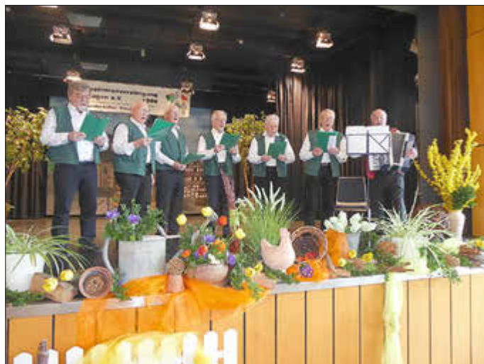
Die Thekensänger aus Wetterburg