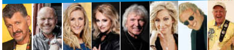
Semino Rossi, Olaf Henning, Stefanie Hertel, Nicole, Peter Orloff, Claudia Jung, Bernie Paul und Graham Bonney

Weitere Infos unter: www.schlager-kanaren.de