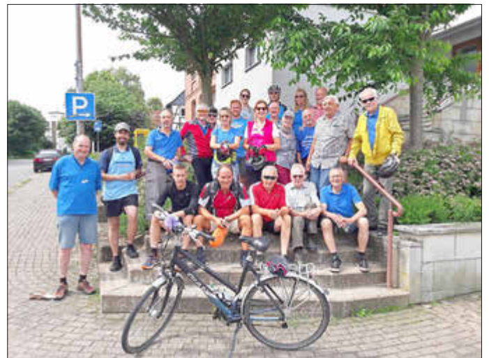
Radeln ist ein Schwerpunkt beim TSV in 2024 ... hier ein Bild aus dem Jahr 2018.