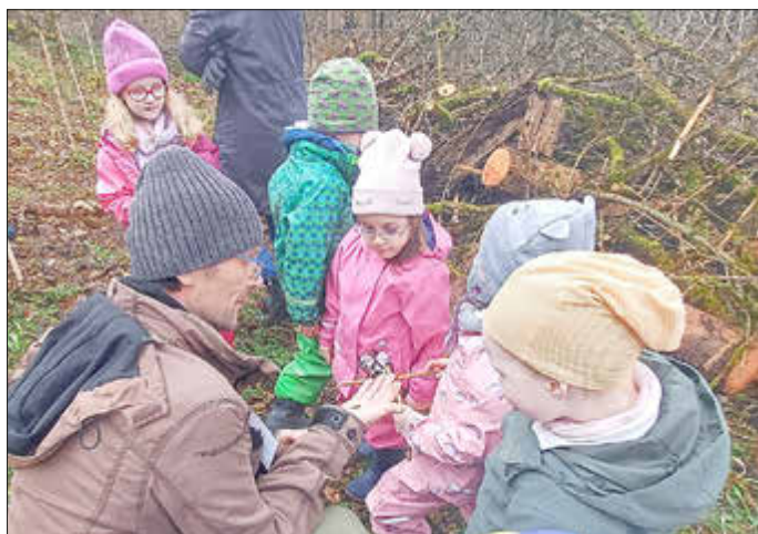
Wir beobachten eine kleine Motte

Nachhaltigkeit und Umweltbewusstsein sind wichtige Themen in der Kita. Je früher Kinder ihre Liebe zum Wald als Lebensraum mit seinen Möglichkeiten entdecken, desto mehr werden sie sich auch im Erwachsenenalter für die Erhaltung einer gesunden und intakten Umwelt engagieren.