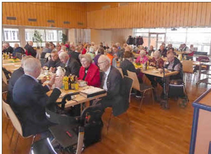
Ein fast voller Saal bei der Frühlingsversammlung den Landse- nioren