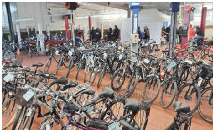
Viele Fahrräder warten in der Kfz-Werkstatt auf neue Besitzer.

„Wir gehen davon aus, dass es wie in den vergangenen Jahren wieder einen Ansturm auf die Räder geben wird, so MSC-Pressesprecher Peter Kranz. Die Verkaufsfläche war immer bis auf den letzten Meter belegt. Ab Verkaufsbeginn finden die meisten Artikel schnell einen neuen Besitzer. So mancher wird auch an diesem Tag ein richtiges Schnäppchen machen.“