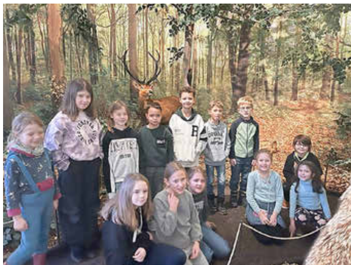
Waldausstellung im Naturkundemuseum Kassel

türlicherweise wäre Deutschland zu über 90 % mit Wald bedeckt, daher sei die Artenvielfalt hier besonders hoch. Die Waldbewohner - vom Borkenkäfer bis zum Rothirsch - wurden in der Ausstellung in großen und detailreichen Lebensraumszenierungen vorgestellt. Sie präsentierten Teile eines großen und verflochtenen Ökosystems, zu dem jede Art etwas beitrage.