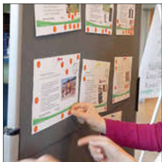
Kinder und Jugendliche während der Projektbestimmung beim Jugendtag in Vellmar im März 2023

Am 14. März lädt die Partnerschaft für Demokratie im Landkreis Kassel zur „Movie Night!“ in den Kulturladen Wolfhagen ein. Jugendliche und junge Erwachsene bis 27 Jahre aus der Region sind herzlich eingeladen, ab 17 Uhr über lokale Projekte abzustimmen, die ihre Freizeitgestaltung direkt betreffen.