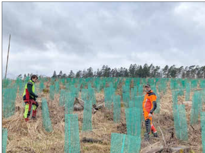
Ihr Forstteam der Stadt Wolffhagen

Sie benötigen lediglich Handschuhe, um die weitere Ausrüstung kümmern wir uns.