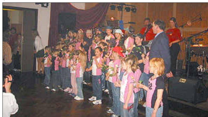
Historienbild: 2007 bei der „Nacht des Sports“ ... am 04. Mai ist es wieder soweit

04. Mai Nacht des Sports, 09. Juni TSV Radtour im Rahmen von BONWAI, 09. September Familien (-Wandertag) zum Vatertag in Isth, 20. Juli Viehmarktsumzug „Wir sind Wolffhagen“ mit Auto und Laufgruppe Crazy Steps sowie Streetdance, 24. bis 25. August Vereinsfahrt zur Sandkerwa nach Bamberg.