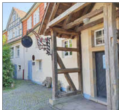
Erzählcafé in der Zehntscheune

Das Team vom Regionalmuseum Wolfhager Land lädt Sie für Sonntag, den 10. März um 15 Uhr herzlich in seine Zehntscheune ein zu einem Erzählcafé. In gemütlicher Runde bei Keksen und Kuchen wollen wir uns über das Thema Magie und Aberglaube austauschen. In welcher Weise erleben wir heute noch magische Momente? Wie stark prägt Aberglaube unser Leben und gibt es spezielle Geschichten, die mit Magie und Aberglaube im Wolfhager Land zu tun haben, die in der Gegend ‚rumgeistern‘? Wir machen uns häufig nicht klar, wie sehr uns alte Sprüche und Gewohnheiten beeinflussen. Das fängt damit an, dass es in unseren modernen ICEs keine Wagen mit der Nummer 13 gibt, da die Zahl 13 Unglück bringen soll. Wer weiß nicht, dass ein vierblättriges Kleeblatt Glück bringt, wer kennt nicht sein Sternzeichen, hat noch nie sein Horoskop gelesen oder noch nie auf Holz geklopft. Die Ergebnisse des Nachmittags sollen in die nächste Sonderausstellung unseres Museums ‚Magie und Aberglaube im Mittelalter‘ einfließen. Sie wird am Donnerstag, den 25. April eröffnet.