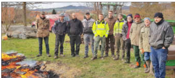
Abschluss aller Beteiligten am Lagerfeuer