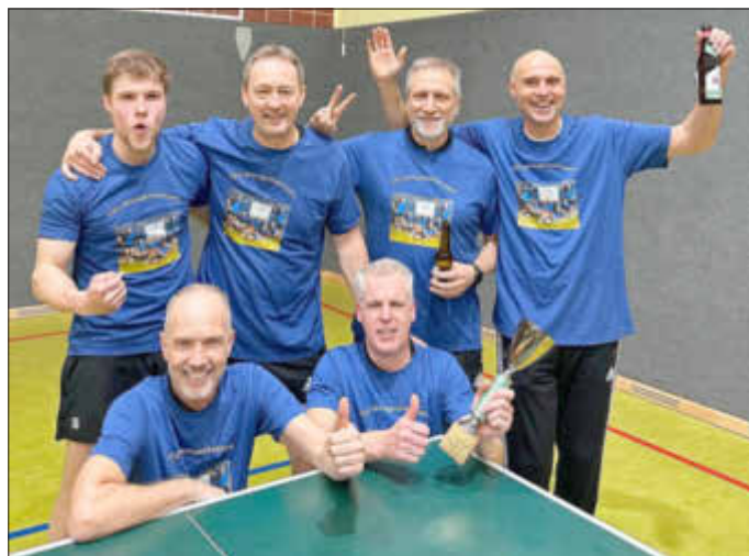
Großer Erfolg im Tischtennis: Die Erste hat die Meisterschaft in der Bezirksliga quasi fast sicher