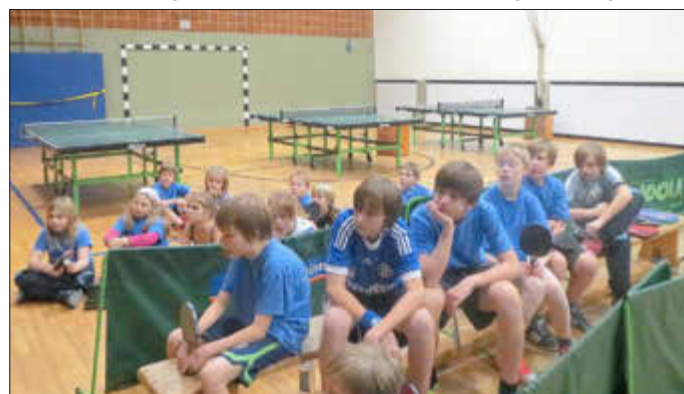
Vereinsstütze Jugendarbeit: Beim TSV wird Jugendarbeit stets groß geschrieben. Hier ein Bild aus dem Jahr 2012.

Samstag 13. Mai TSV-Radtour, Samstag 10. Juni Nacht des Sports, Sonntag, 24. September Kreiswandertag in Wenghain.