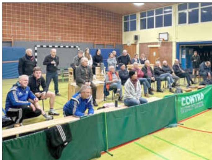
Volle Halle: Beim 9:5 Sieg der Ersten gegen Rengershausen war top Stimmung in der Erpetalarena

Im Rahmen eines Rollenspiels konnten die 10 Vorschulkinder