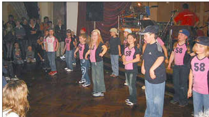
Streetdance Anno 2004, damals hieß das jährliche Event vom TSV noch Kameradschaftsabend.