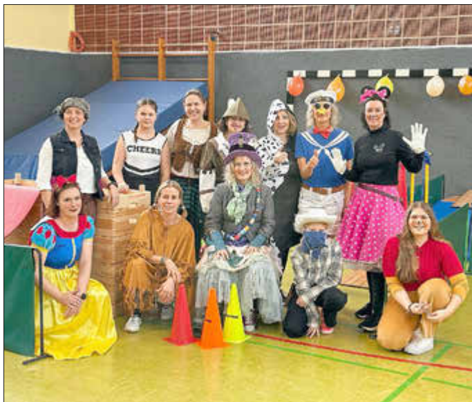
Eine mega Party war der Kinderkarneval am Karnevals-Wochenende beim TSV. Hier auf dem Bild die Organisatorinnen.