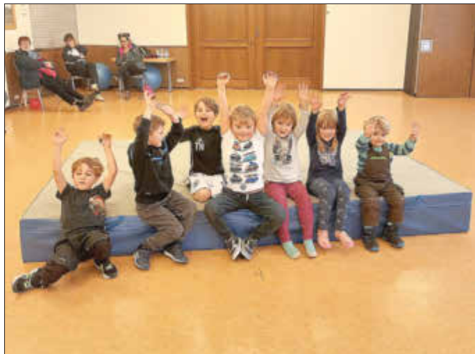
Eine der Gruppen in Bründersen

Das Angebot Ringens und Raufen gibt es seit 2022 beim TSV Bründersen. Wir wollen Ihnen/Euch heute einige Informationen zum Trainingsbetrieb geben.