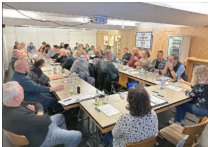
Ein volles Haus gab es bei der TSV Jahreshauptversammlung