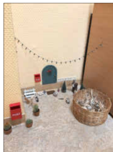
Unsere Wichteltür mit Wachtelnest

Alle Kinder konnten nacheinander die Wachteln beobachten, füttern und einen bewussten Umgang mit den Tieren erlernen. Sie erfahren, wie Wachteln leben, was sie gerne fressen und wie viele Eier sie legen können. Ganz schön spannend fanden alle Kinder. Viele Kinder kümmerten sich liebevoll um die gefederten Tiere. Andere hielten lieber etwas Abstand und waren mit gucken und zuhören völlig zufrieden, was vollkommen in Ordnung ist. Abschließend gesagt, war es eine tolle Überraschung, die sich unser Wichtel Lasse ausgedacht hat. Da waren sich alle Kinder einig.*Kurze Erklärung zu diesem Spiel: Bei der aus Skandinavien stammenden Tradition zieht zu Weihnachten der sogenannte Nisse (dänisch für Wichtel) ein. In Anlehnung an diesen Brauch sind wir gemeinsam mit den Kindern in die Geschichte von Nisse eingetaucht. Der fiktive kleine Freund lebte bei uns hinter einer Wichteltür, oberhalb der Fußleiste. Tagsüber schlief er und nachts schlich er dann heraus. Er bereicherte die Kinder im Kindergarten mit winterlichen Ideen und manchem Streich bei dem ihn die Erzieher*innen unterstützten.