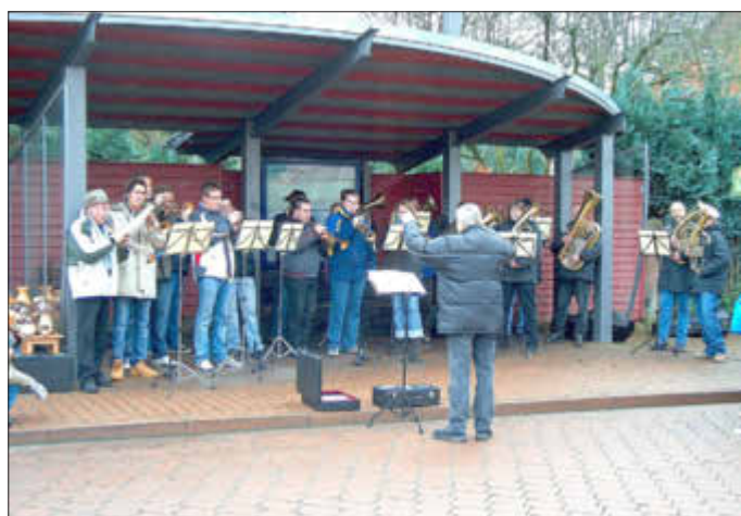
Weihnachtsmarkt 2005: Auftritt des Posaunenchor Istha