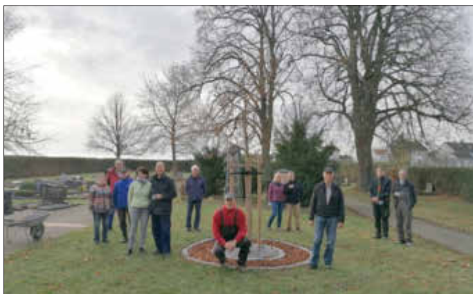
Gruppenbild nach getaner Arbeit