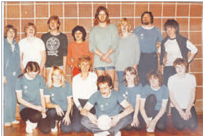
Ein Blick in die TSV-Historie: Auch eine Volleyballsparte gab es mal beim TSV in den 80ern.

TSV JHV und Wanderung am 16./17.1.2021, Familienwandertag 03.06., Kreiswandertag 26.09. und Ehrungstag 30.10.2021. TSV Wenigenhasungen, wir sorgen für Bewegung!