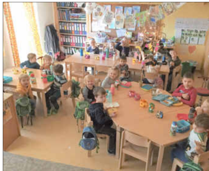
Gemütliches Frühstück und wir danken für das gute Mahl

Die Figuren, Tücher, Blätter, alles was auf dem Tisch stand, nutzen die Kinder noch Tage später, um die Geschichten nachzuspielen.