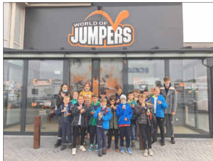
Die Teilnehmer*innen der Fahrt ins Jumphouse

Noch voller Adrenalin haben wir uns dann auf den Rückweg gemacht. Wieder in Wolfhagen angekommen wurden die Kinder schon freudig erwartet und ein weiterer, schöner Ausflug nahm sein Ende.