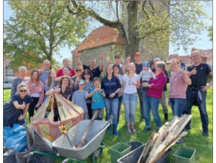
Ein Bild aus 2019: Die TSV'er sorgten für einen sauberen Erpestrand

TSV Wenigenhasungen, wir sorgen für Bewegung!