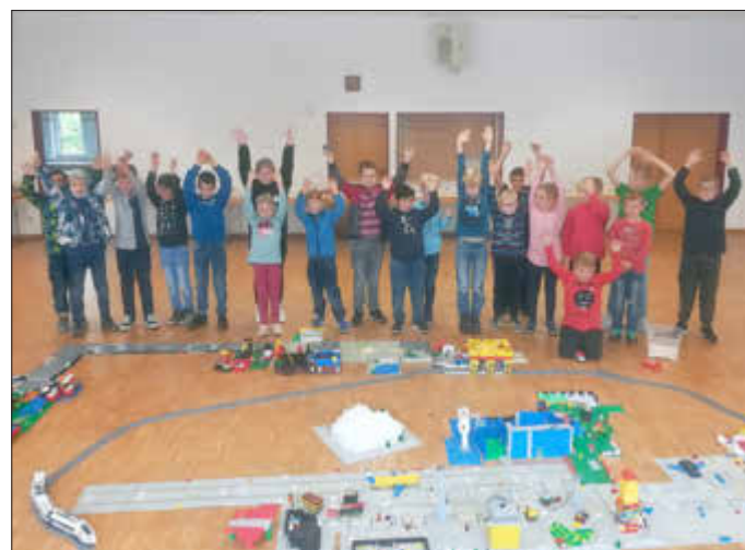
die Legoprojektgruppe 2020

Gegen Mittag konnten sich die Kinder an einer warmen Mahlzeit stärken, damit sie anschließend tatkräftig weiterbauen konnten. Auch am zweiten Tag gingen den Kindern die Ideen nicht aus. Sie bauten fleißig an ihren Werken weiter, entwickelten weitere neue Gebäude und fügten Straßen mit selbstgebauten Fahrzeugen und zwei Flugzeuge hinzu.