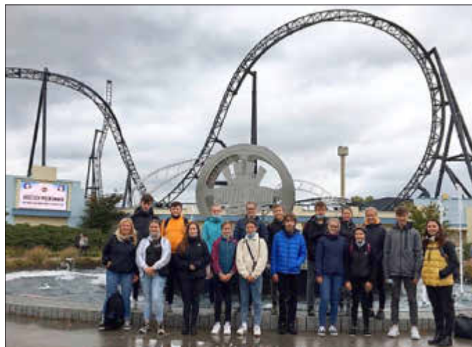
Teilnehmer der Fahrt in den Movie Park

Nach einem wunderbaren, langen Tag im Moviepark haben wir dann die Heimreise angetreten.