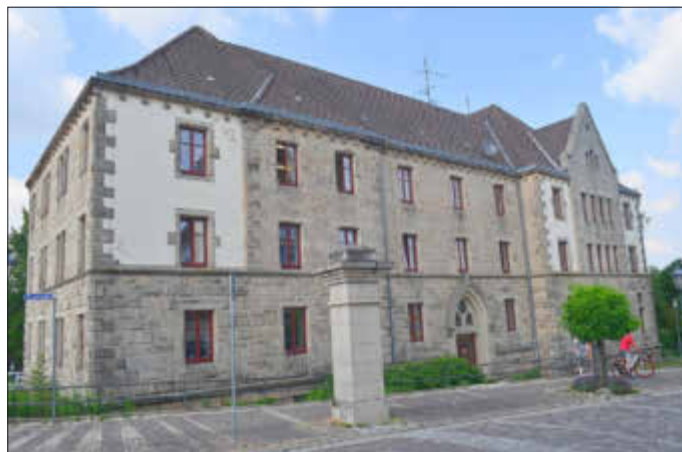
Musikschule Wolfhager Land: Musikunterricht ist Bildung!

Kurfürstenstr. 1, 34466 Wolfhagen Tel. 05692 7967 info@musikschule-wolfhager-land.de www.musikschule-wolfhager-land.de